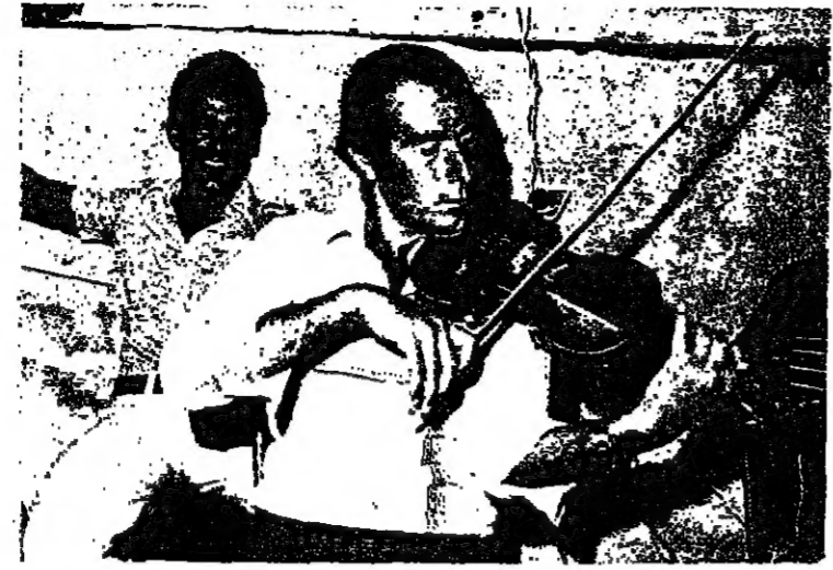
الحديث ، ولست ان الفئان وليسم آراء عديدة وجهات نظر معينة حول الفن المحلي ، فربما ان اسجل هذه الملاحظات .

ثم ان لي استعدادا كبيرا للتعليم ولدي محاولات جيدة ، وقامت الاذاعة الاسرائيلية بتسجيل احد الحانها ، بينما ما زالت انتظر رد عمان وينداد حول الاذعان التمسيسي ارسلتها اليهما .